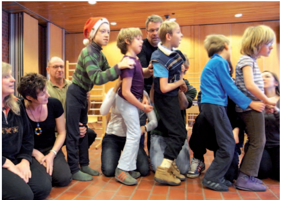
Laufen Lernen nach der Konduktiv-Mehrfach-Therapie: Die Kinder spielen Lokomotive, das macht mehr Spaß als starres Üben.