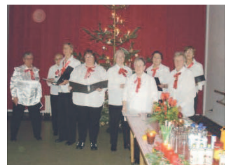
Der Arietta Chor Bergedorf

"Das Adventskaffeetrinken hat auch seine Tradition", sagt Mar-